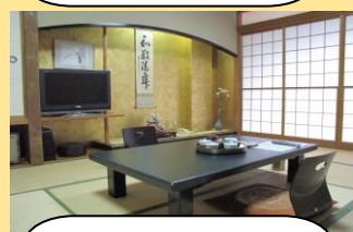
落ち着いた 客室 和室