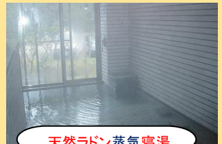
天然ラドン蒸気寝湯