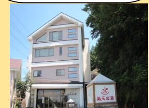
ホテル入口と源泉