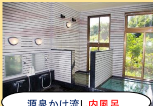
源泉かけ流し内風呂