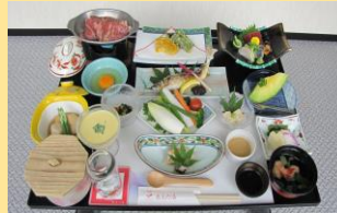
料理は季節により変わります