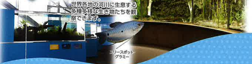
スリースポット グラミー