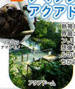
ラクダ ナマケモノ