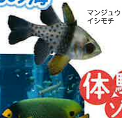
マンジュウイシモチ

珊瑚礁がつくる美しく神秘的な自然世界。色鮮やかで個性的な魚たちが織りなす海の楽園が目の前に広がります。