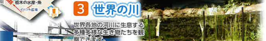
スリスポットグラミー