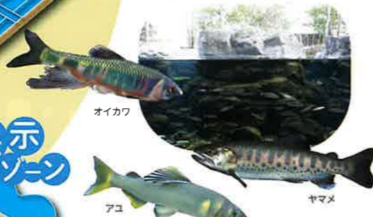
オイカワ、アユ、ヤマメ

那須岳から自然豊かな那須野が原、八溝の大地を流れる那珂川が育む魚たちの生活を覗いてみてください。