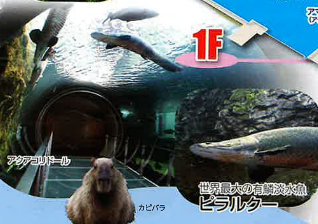
アクアコリドール