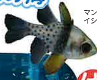
マンジュウ イシモチ

珊瑚礁がつくる美しく神秘的な自然世界。色鮮やかで個性的な魚たちが織りなす海の楽園が目の前に広がります。