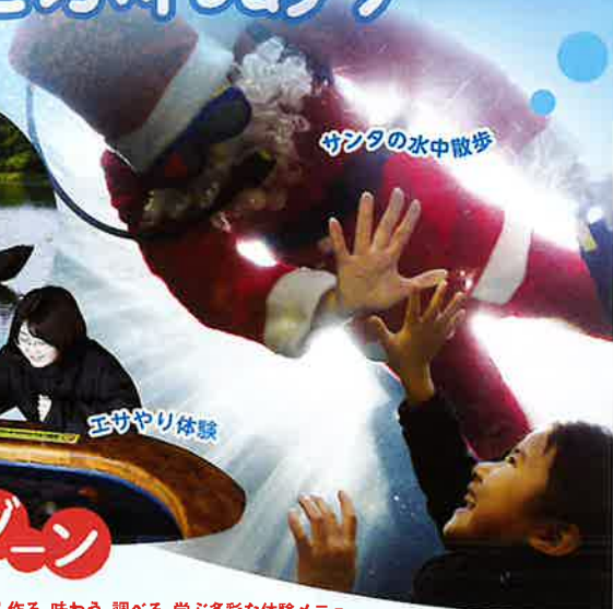
サンプラの水中散歩