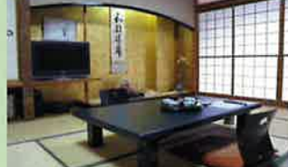
落ち着いた 客室 和室