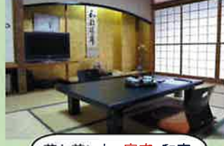
落ち着いた客室和室