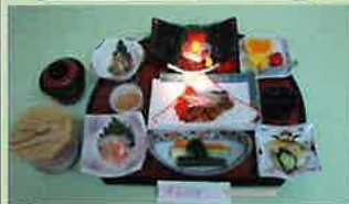
料理は季節により変わります