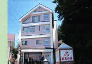
ホテル入口と源泉