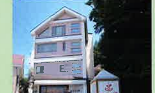
ホテル入口と源泉