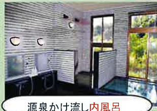
源泉かけ流し内風呂