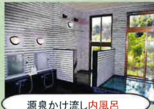
源泉かけ流し内風呂