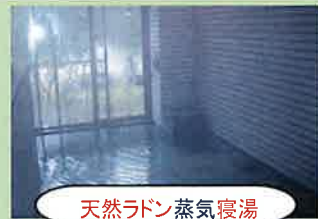
天然ラドン蒸気寝湯