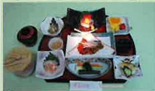
料理は季節により変わります