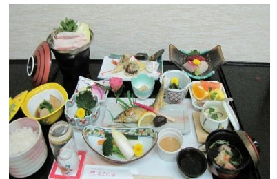
(料理は季節により変わります)

(ホテルに於けるクレジットカード精算は VISA 又は MasterCard のみとなります。)