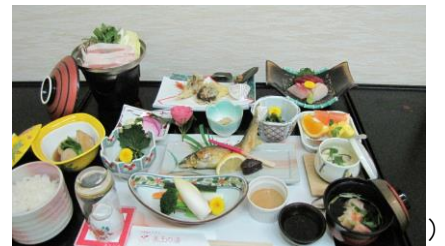
※プラス1,000円で宴会料理にアップ)