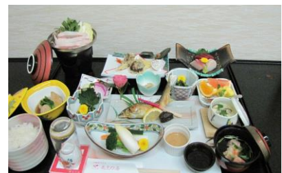
※プラス1,000円で宴会料理にアップ可)