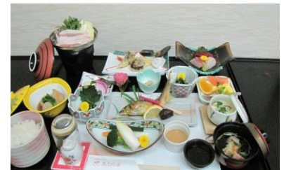
◆料理は一例(季節の料理をご提供) ※プラス1,000円で宴会料理にアップ)