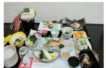
(料理は季節により変わります)