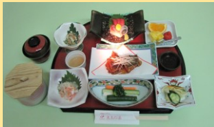
料理は季節により変わります