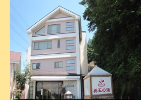
ホテル入口と源泉