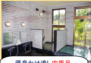
源泉かけ流し内風呂