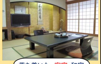
落ち着いた客室和室