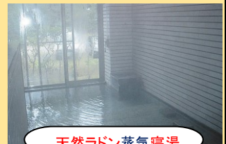
天然ラドン蒸気寝湯